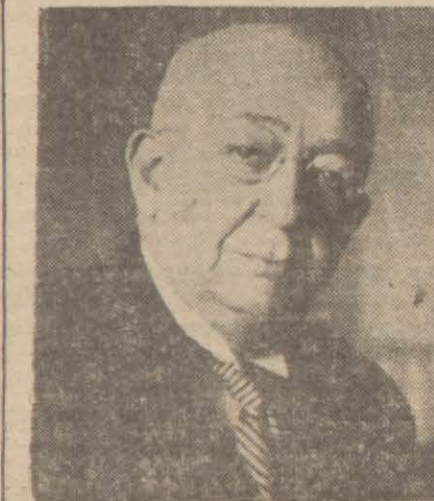
Başvekil Dr. Refik Saydam

Biraz daha şimalde İtalyanlar karışık bir halde ric'at etmektedirler. Şimal muntakasındaki İtalyan kuvvetleri Yunan kuvvetleri tarafından yapılan üç şiddetli taarruzdan sonra kaçarak şimal muntakasından atılmışlardır. Aynı zat, sunları ilâve etmiştir: İtalyanlar, ancak havaalarm fena gitmesi yüzünden mahvolmaktan kurtulmuşlardır.